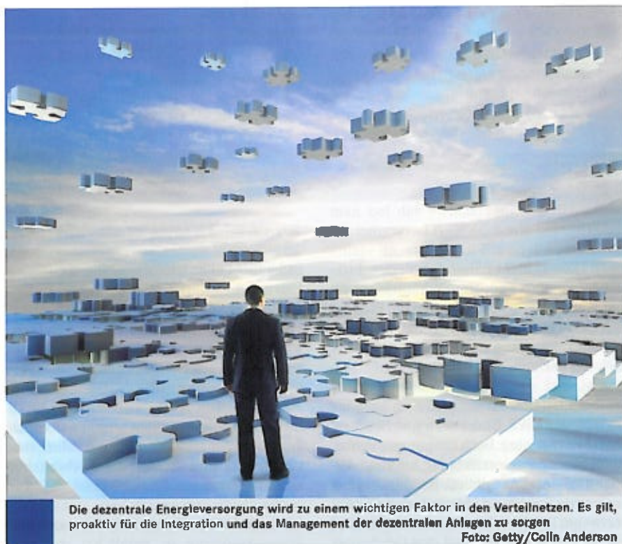
Die dezentrale Energieversorgung wird zu einem wichtigen Faktor in den Verteilnetzen. Es gilt, proaktiv für die Integration und das Management der dezentralen Anlagen zu sorgen

Eine Systematisierung der technisch-ökonomischen Auswirkungen dezentraler Optio-