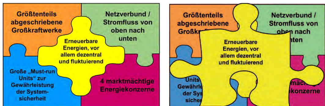
Abbildung 1 „Marktintegration“ erneuerbarer Energien zwischen Wunschenken und Realität