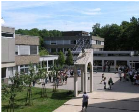
Hof HTW Waldhausweg